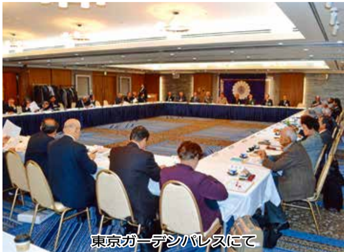
東京ガーデンパレスにて

病がはやるよとか社会の外からの影響で起こっているのではなく、社会そのものの内部に起こっていることに、私達は注目しなければならぬと思います。