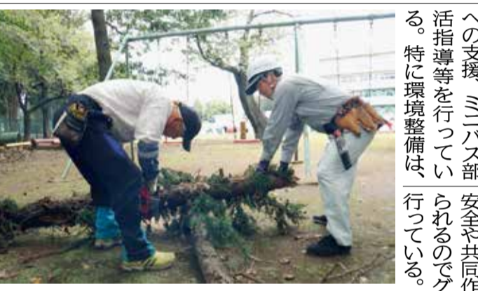
8名6校で試行した。実施した学校からはたくさん感謝の言葉をいただいた。支援に参加した会員からは、現場の大変さと支援の必要性と共に、役に立つ活動ができた喜びが寄せられた。