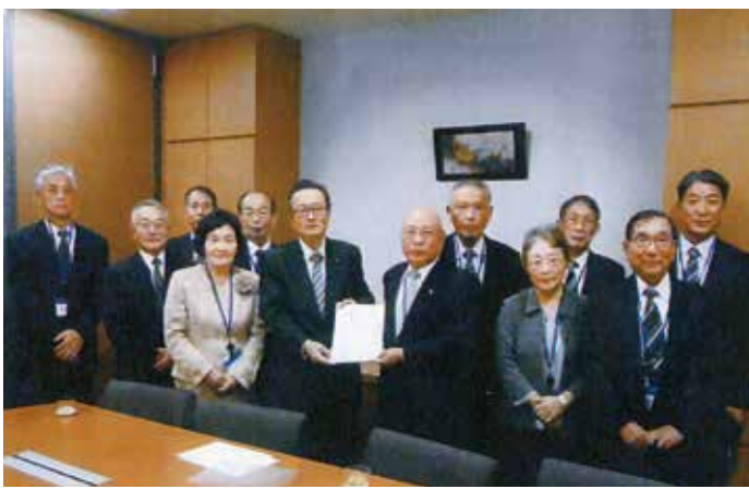
国会議員の方に要望書を手渡す 栃木県連宇都宮支部の皆さん

■ 女性部の活動 逆風の中での会員勧誘活動は、従来の基盤の上に新たな工夫を加えて、各退公連で進められる。