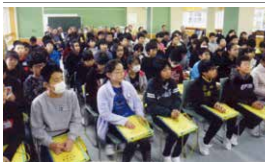
真剣な眼差しで説明を聞く児童たち。後方に飯島塾塾生たち

秋田県連の巻 像に見入る児童たちの姿が印象的であった。◆縄文時代からの飯島の歴史を知ることが出来た。また、先人が海岸の大飛砂と戦い一生懸命植林し、飛砂を防いだことで日本一の松林になったことを初めて知った。