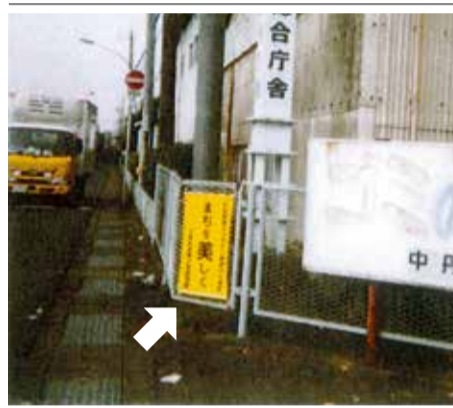
京都の街角に 年金制度を次世代に まちを美しく 京都府退職公務員連盟

時移って、令和2年度の日公連の事業計画には「活力ある長寿社会の実現」を謳う。国の再建気運と少子高齢社会という背景は違っても活力と品位のある日本の社会を創るために多彩な知見を活用しようという点では全く変わりはない。 現実には、このことは全国の退公連で既に認識されている。一人一人の退職公務員が積み上げた経験と知恵は量的にも、質的にも社会的に高く評価されるが、活用されないまま埋もれてしまうケースも多い。もったいない話である。 会員が自分の経験や知識を子どもや若者や地域に役立てる活動は組織の理解を深め、自身は心の報酬を得ることになる。 それ故に、退公連が一旦心を決めて起せば、国や社会の信頼を得る歴史の評価に耐え得る実績を積み可能性は十分にある。連盟草創期の再現も夢ではない。退公連の会員であることに誇りを持ち、自らも高みを目指す日常を紡ぎたい。「求めれば、誰でも生き直すことができる。」