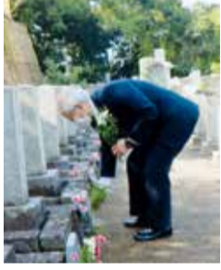
清掃活動が終わると、墓地の北隅にある一つのベンチに座り、掃き清められた墓地、墓標に語りかけるように暫く談笑する。

清掃する者、階段を清掃する者、実にはききと活に各自自主的に清掃活動が動いている。この8名全員元教師である。現職時代には学級経営、教科等の指導・経営、そして学校経営等に於いて、生徒や先生、保護者、地域の方々に対して、人権問題、自由、平等、博愛、戦争と平和等について、また、国際教育に関して、語りかけ、指導し実践をしてきた。このロシア兵墓地清掃活動は、教え、語りかけてきたことを再現することで、慰霊の気持ちの証しであり、慰霊の心ともなっている。毎回作業を通して実感している。