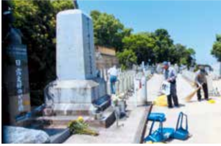
ロシア兵墓地の清掃活動の様子

今、「ロシア兵墓地」清掃の一翼を担っているのが私達8名の「木曜会」会員である。清掃活動は毎月奇数週の木曜日に、午前10時