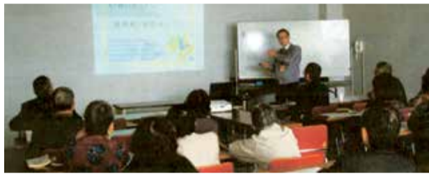
支部研修会の様子