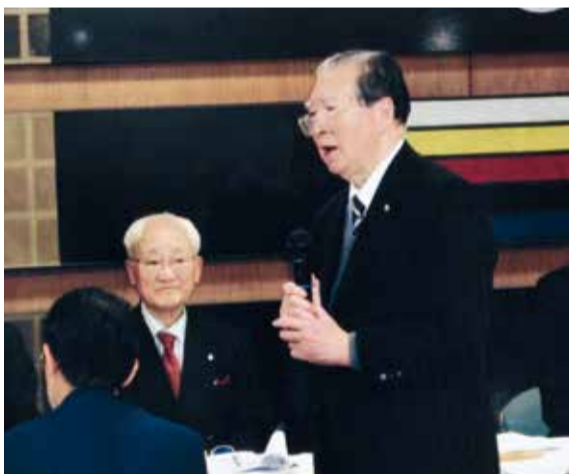
予算・税制に関する政策懇談会