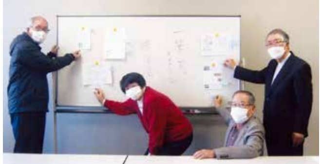
「一筆箋コンクール」選考会

組織部では、令和2年度より「一筆運動」を展開し、「二筆箋の書き方」「同実践例」を幹事さんに配布して運動を推進してきました。さらに、令和3年度は運動をより進めるために第1回「二筆箋コンクール」を実施し、会員に周知を図っています。