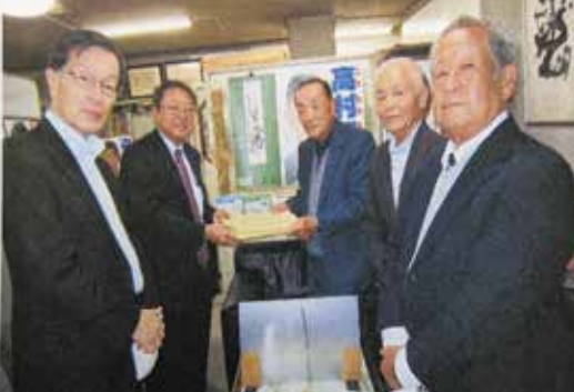
要望書の手交 (山口県連)

一 公的年金を含む社会保障給付費の財源は 、安定した雇用と着実な経済成長による税収及び各種保険料収入の増加等により確保されたい。 二 超高齢社会・人口減少社会で 、労働力人口を確保するためには、健康で働く意欲のある高齢者及び女性、特に子育て世代が安心して働きやすい労働環境の改善整備に努められたい。 三 我が国の人口が減少し続ける現実を注視して 、少子化問題の解決を積極的に推進されたい。 現役世代との公的年金の給付水準比較に当たっては、現役世代と同様に各種保険料等を年金から控除するとともに、単身高齢者世帯の増加にも留意して実施されたい。