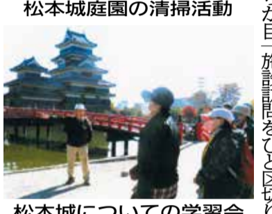
松本城庭園の清掃活動