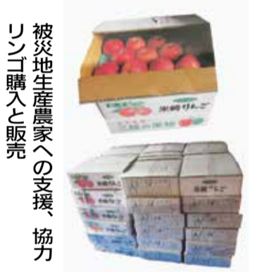
被災地生産農家への支援、協力リンゴ購入と販売