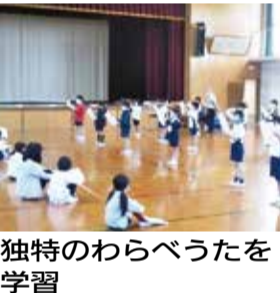
京都独特のわらべうたを体験学習

99号誌上では、「京のわらべうた教室」と銘打って小学生にわらべうたを伝承している活動を掲載しました。「丸竹夷」や「祇園の