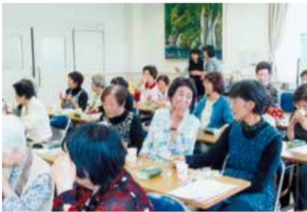
女性部・女性の集い