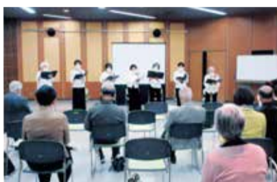
研修会・皆で唱和する会員