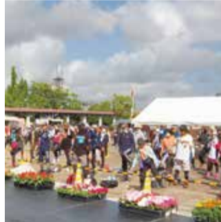
出発前の準備運動をしっかりと

ここを発着点に5km・10km・20km・35kmの部と、いろいろなコースが設けられている。これが2日間開催されるのだが、我々は最初の1日だけ参加している。退公連仲間からの参加が5kmの部と10kmの部の参加が妥当なところだが、健脚仲間には2日間歩く方もある。この大会に参加するようになったのは、5年前の理