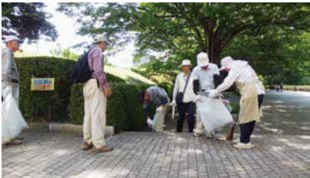
和気あいあい一生懸命です

参加しながら元の職場の先輩やいろいろな人と出会い、退職後の生活について貴重な意見をいただきました。その後地区委員を担当し、今では、支部の社会貢献活動部長として活動しています。 昔のことを思い出しながら残念に思うこともありますが、それは退会連の加入者が少なくなり、コロナの影響もあってか各活動の参加者が減っていることです。多くの方が参加されるよう更に工夫を凝らしてまいります。 元気で 明るく 朗らかに「公園清掃。仲間と一緒にさわやかな一日を過ごしませんか？世のため、人のため、自分のためです。