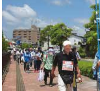
のぼりを掲げて、さあ出発!

事会懇親会の席でウォーキング愛好家らしく話した。退公連をPRできたのは、今年(退職公務員連盟中部支部)は少し減ったが、会員を中々減らさないようにしたい。退公連をPRできるいい機会にもなると考えたからである。令和2年