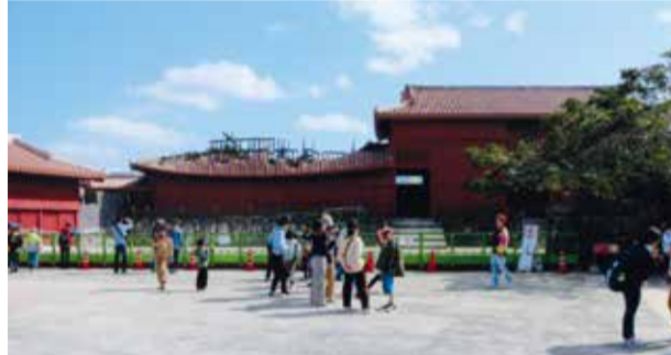
下之御庭から奉神門を撮る。その背後に正殿の偉容があった

早朝六時、その公園の中心で、東側の首里城のある稜線に向かい、ストレッチとウォーキングを日課として